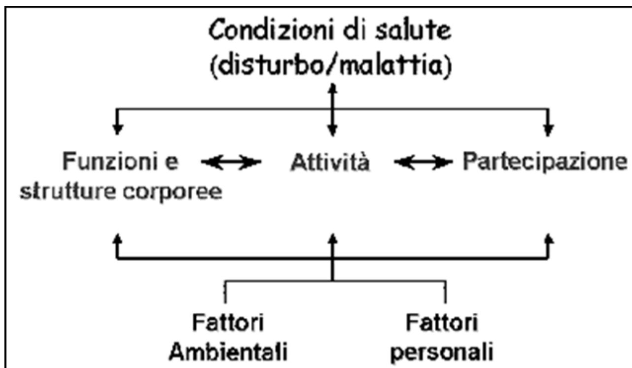
Figura 1: il modello biopsicosociale di salute e disabilità e le interazioni tra le componenti dell'ICF.